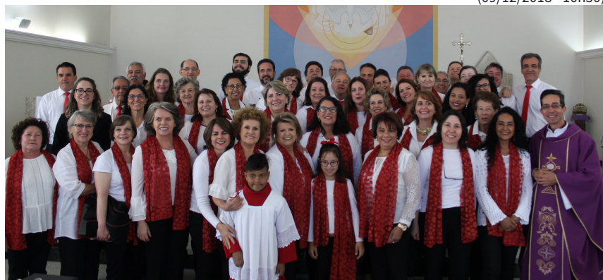
Celebração com a animação do Coral do Santuário Sagrado Coração de Jesus. (09/12/2018 - 10h30)