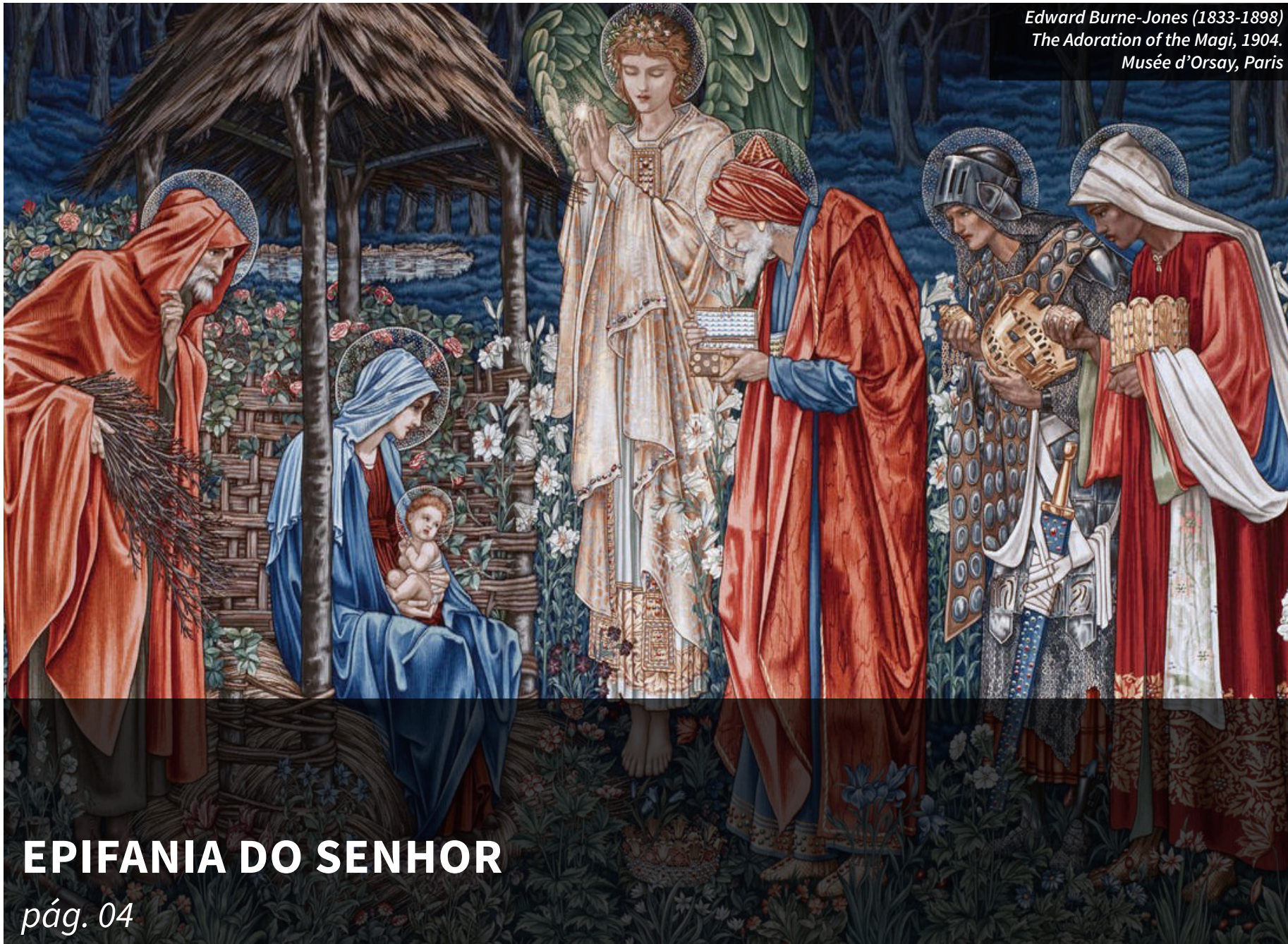
Edward Burne-Jones (1833-1898) The Adoration of the Magi, 1904. Musée d'Orsay, Paris